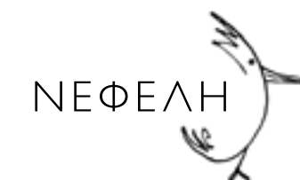
Ο κύριος Αρρρρρρ