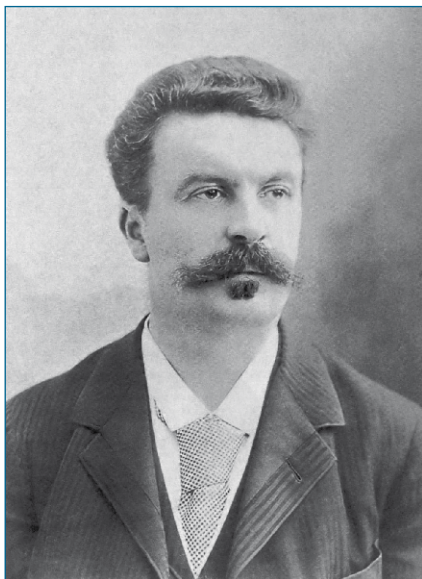
Ο Maupassant από τον Félix Nadar, το 1888.

https://fairead.net/files/NEFELI/authors/maupassant/maroka/pagesFrom-maupassant-maroka.pdf