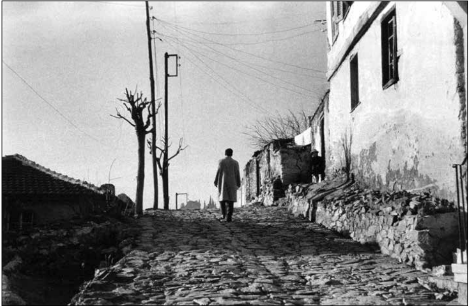
Άνω Πόλη Θεσσαλονίκης (1956).